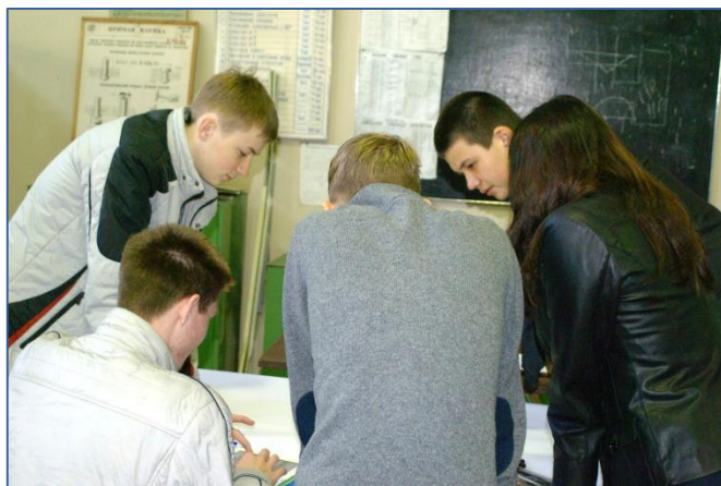
Изготовление летающей модели самолёта

Команда учащихся «Клуб любителей физики» решает задачу по физике и математике за 1 час